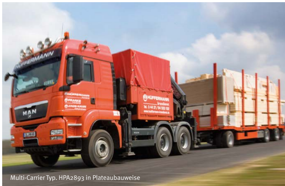
Multi-Carrier Typ. HPA2893 in Plateaubauweise

bindern sowie Fertighäusern ausgelegt. Der Multi-Carrier ist in den Fahrgestellängen 8.300 mm und 9.300 mm lieferbar.