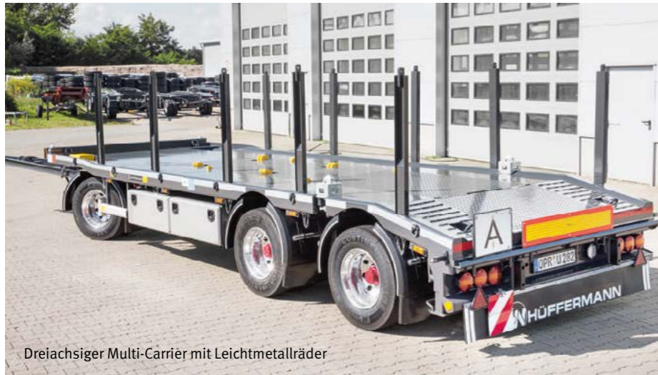
Dreiachsiger Multi-Carrier mit Leichtmetallräder

garantiert. Hüffermann verwendet nur erstklassige Fahrzeugbauteile namhafter Hersteller, was sich für Sie durch Langlebigkeit über die Einsatzzeit auszahlt. Sprechen Sie uns an, wir beraten Sie gern!