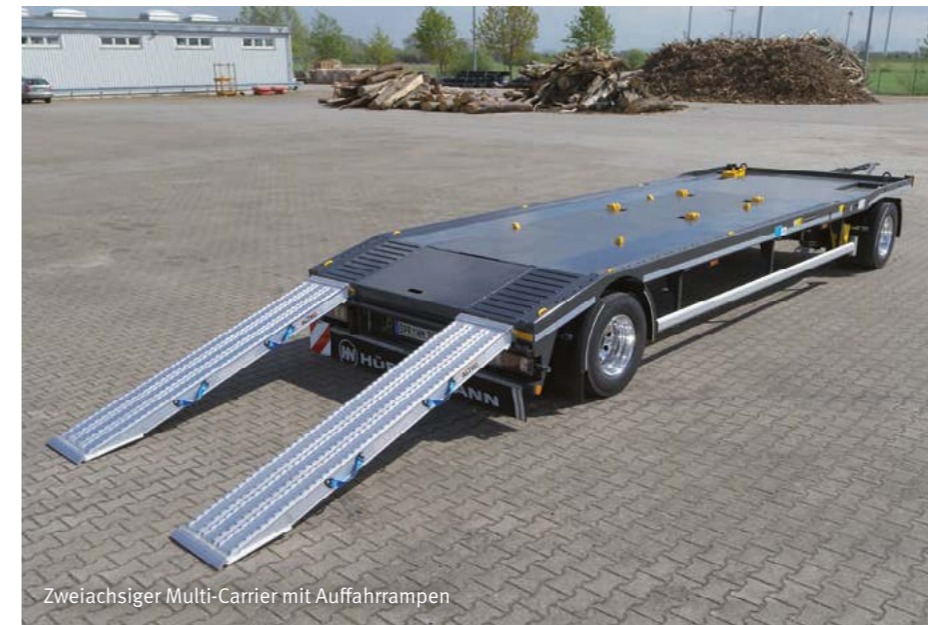
Zweiachsiger Multi-Carrier mit Auffahr-rampen

von 5.700 mm – 7.200 mm lieferbar. Die dreiachsige Variante ist in drei Varianten bis zu einer Fahrgestell-länge von 8.300 mm.